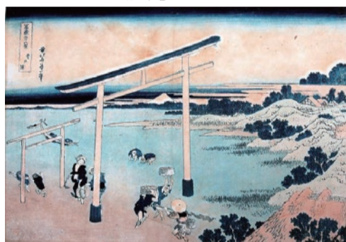
富嶽三十六景のうち「登戸浦」 葛飾北斎画 船橋市西図書館所蔵